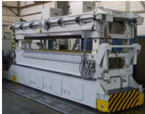
Lavadora de cinta/chapa