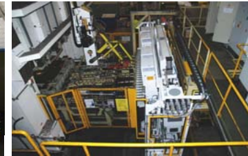
Cepilladora integrada en línea