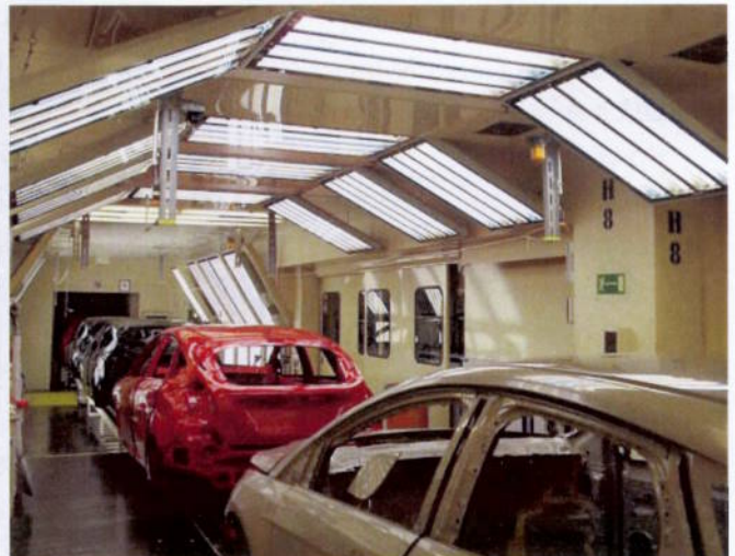
Nach dem Umbau