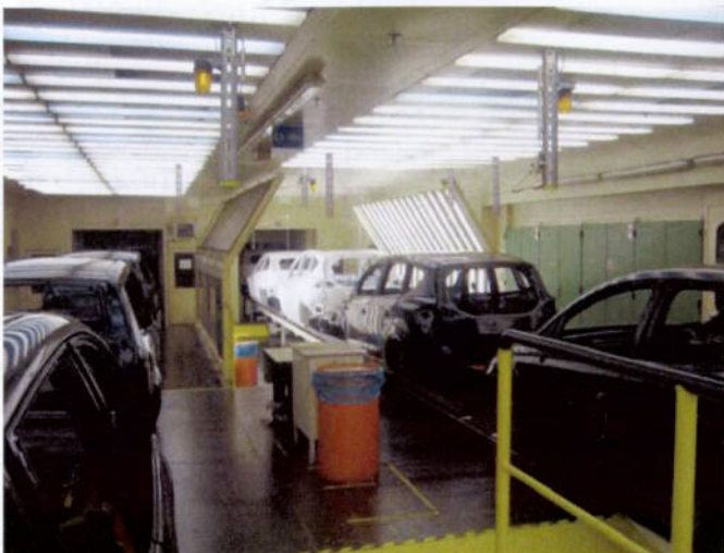
Vor dem Umbau

Deutlich sichtbar die Verbesserung der Fehlererkennung und die damit verbundene Fehlerbeseitigung bei dem System 1 (blauer Balken)